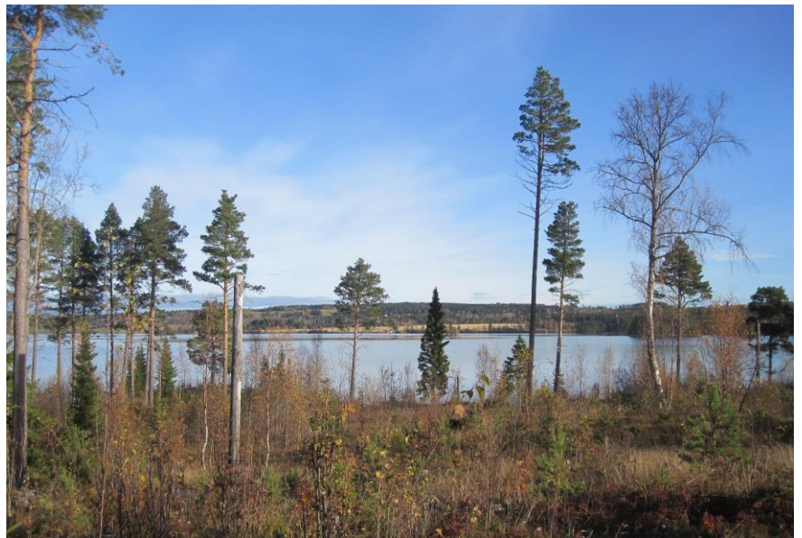
Utblickar från tomtlägen mot Storsjön

Inom området avses 54 tomter för fritidshus och permanentboende med varierande storlek tillkomma. Ambitionen har varit att sträva efter större tomter för att därigenom ge området en naturnära kvalitet. Tomterna är som regel minst 40 m breda mot väg och kommer i de flesta fall att ha en gräns mot orörd natur. För att inte skymma utblickar mot sjön från de hus som är belägna längre in i planområdet, tillåts endast en våning utan inredd vind närmast stranden. Sluttningsvåning får byggas där marken sluttar mer än 2 m inom byggplatsen. Inom de delar av planområdet som ligger längre från stranden medges tvåvåningshus. Inom